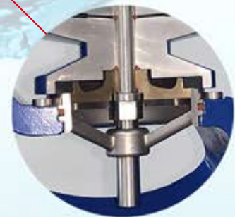
Asiento y Vástago en Acero Inoxidable AISI 316.