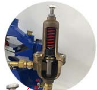
Piloto Reductor Modelo 160