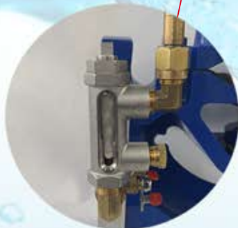
Filtro Estandar en Acero Inoxidable.