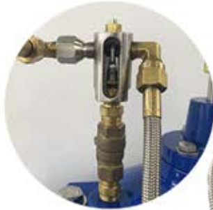
Estabilizador de Caudal Modelo 26 (Acero inoxidable).